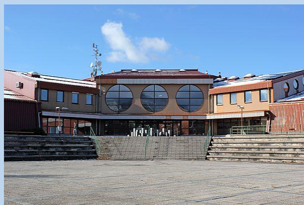
ŠOLSKI CENTER POSTOJNA CESTA V STARO VAS 2 POSTOJNA